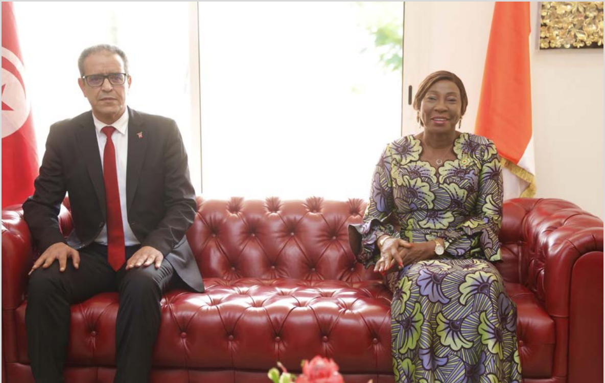
Madame Kandia CAMARA, Présidente du Sénat ivoirien et Monsieur Imed DERBALI, Président du Conseil national des Régions et des Districts de la République tunisienne

En marge de la cérémonie solennelle d'ouverture de la première session ordinaire de l'année 2026 du Sénat, Madame la Présidente Kandia CAMARA a reçu en audience, le 29 janvier 2026 à Yamoussoukro, Monsieur Imed DERBALI, Président du Conseil national des Régions et des Districts de la République tunisienne, invité d'honneur de cette cérémonie.