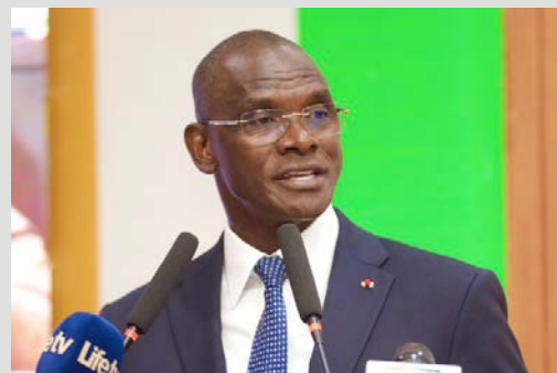
Général Vagondo DIOMANDÉ, Ministre de l'Intérieur et de la Sécurité

« Aucune décentralisation ne peut être pleinement effective sans une autonomie financière réelle. C'est pourquoi le gouvernement s'attèle à revoir les mécanismes de transfert des ressources afin de les rendre plus équitables, afin de les rendre tout aussi prévisibles, à renforcer aussi la transparence et traçabilité des flux financiers, à encourager la mobilisation des ressources propres des Collectivités mais aussi à promouvoir des instruments innovants, notamment des partenariats public-privé. Il s'agit en définitive de garantir aux Collectivités territoriales les moyens d'exercer pleinement les compétences qui leur sont confiées ».