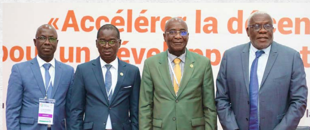
Les intervenants du panel 1

Les échanges se sont articulés autour de trois axes majeurs : l'analyse des conclusions de la mission d'évaluation du Sénat sur le transfert des compétences, l'identification des principaux blocages freinant l'effectivité du processus ainsi que les pistes d'amélioration, et enfin le partage des résultats de l'étude relative aux collèges de proximité dans le cadre de la politique de décentralisation.