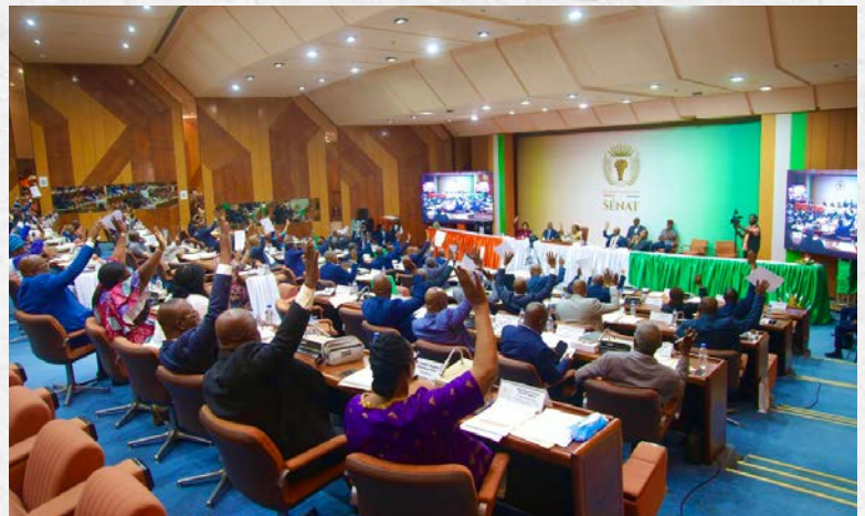
Une vue de la salle lors de la séance plénière de délibérations du Sénat sur six (06) projets de loi - 05 mai 2026