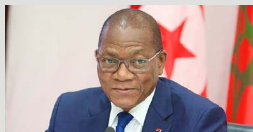
Monsieur Bruno Nabagné KONÉ, Ministre de l'Agriculture, du Développement Rural et des Productions Vivrières, Président du Conseil Régional de la Bagoué.

C'est à ce prix que nous allons faire de nos régions de véritables moteurs du développement inclusif, équilibré et durable que notre pays souhaite. Parce que notre action doit être une action qui impacte positivement la vie quotidienne de nos populations ».