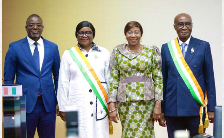
Séance plénière de ratification des listes des Commissions permanentes et d'approbation du calendrier des travaux couvrant la période du 13 mars au 19 juin 2026 - Présentation des nouveaux Sénateurs nommés - 13 mars 2026