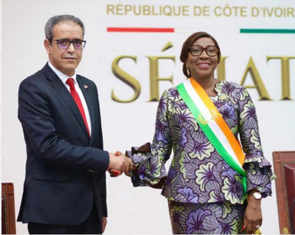
Ouverture de la première session ordinaire 2026 - La Présidente du Sénat ivoirien et son homologue du Conseil national des régions et des districts de Tunisie - 29 janvier 2026