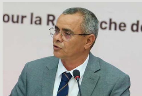
Monsieur Imed CHETTAOUI, Parlementaire tunisien

« L'expérience tunisienne met en évidence un principe essentiel : la décentralisation ne se limite pas à un transfert de compétences ; elle implique une transformation plus profonde. Elle suppose de considérer le territoire comme un véritable acteur du développement. Le Conseil national des Régions et des Districts s'inscrit pleinement dans cette dynamique en rapprochant la décision publique du citoyen et en donnant une place réelle aux territoires dans la construction des politiques publiques ».