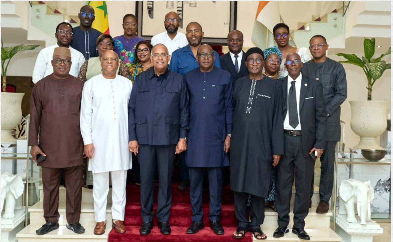
Photo d'ensemble de la délégation ivoirienne

La 32 ème Assemblée régionale Afrique de l'Assemblée parlementaire de la Francophonie (APF), organisée par la section sénégalaise, s'est tenue les 18 et 19 mai 2026 à Dakar, au Sénégal.