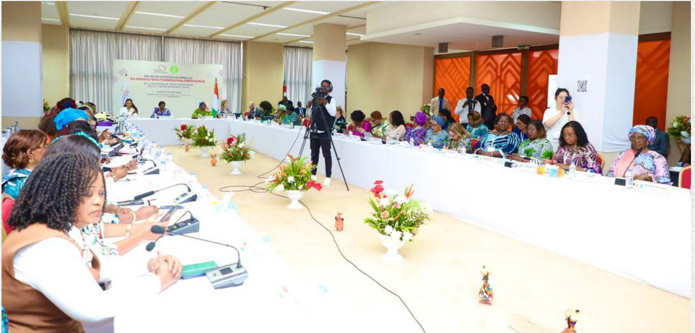
Une vue de la salle des travaux

Réuni à Yamoussoukro dans le cadre de sa réunion intersessionnelle, le Réseau des Femmes parlementaires de l'Assemblée parlementaire de la Francophonie (APF) a examiné un ordre du jour dense, marqué notamment par la présentation du rapport d'activités (juillet 2025 - mars 2026), l'étude de projets de résolutions sur la lutte contre la traite des personnes, ainsi que des communications sur des enjeux tels que le sexisme hostile et paternaliste.