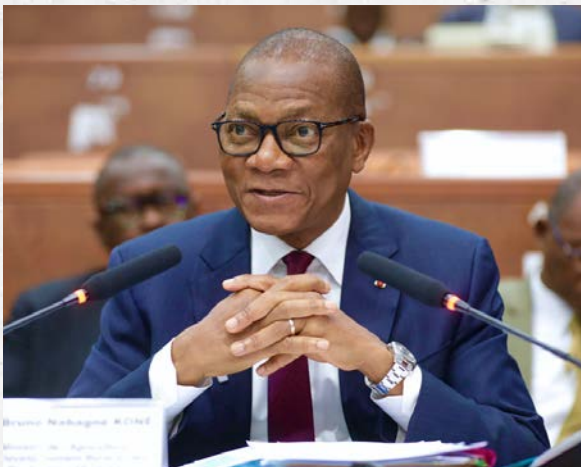
Monsieur Bruno Nabagné KONÉ, Ministre de l'Agriculture, du Développement rural et des Productions vivrières, lors de l'examen par la Commission des Affaires Économiques et Financières de trois (03) projets de loi de ratification d'ordonnances - 30 avril 2026