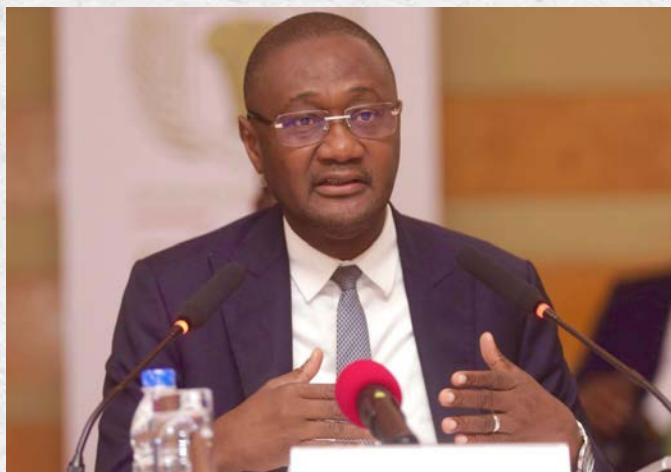
Monsieur Moussa SANOGO, Ministre de l'Urbanisme, du Logement et du Cadre de Vie, lors de l'examen par la Commission de la Recherche, de la Science, de la Technologie et de l'Environnement (CRSTE) d'un (01) projet de loi - 9 juin 2026