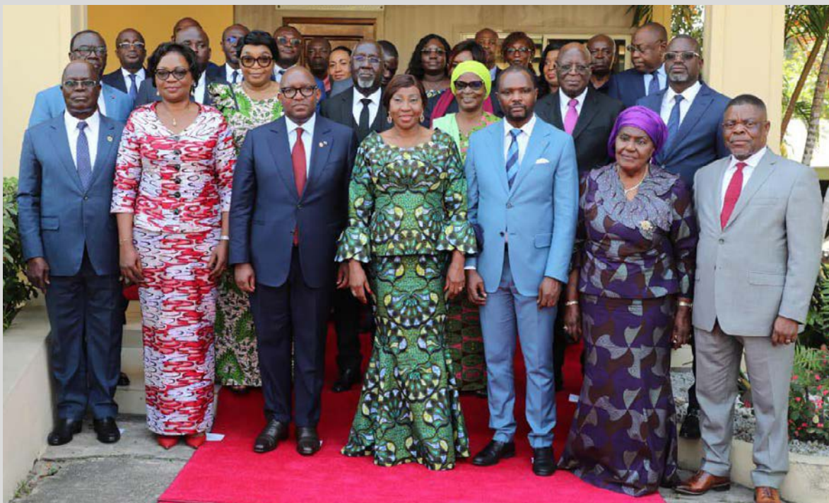
Photo d'ensemble avec au centre Madame Kandia CAMARA, Présidente du Sénat, et à sa droite, Monsieur Jean-Michel Sama LUKONDE KYENGE, Président du Sénat de la République Démocratique du Congo (RDC)

La Présidente du Sénat de Côte d'Ivoire, Madame Kandia CAMARA, a reçu en audience, le jeudi 5 février 2026 à la permanence du Sénat à Abidjan, Monsieur Jean-Michel Sama LUKONDE KYENGE, Président du Sénat de la République Démocratique du Congo (RDC) et Président du Comité exécutif de l'Union parlementaire africaine (UPA).