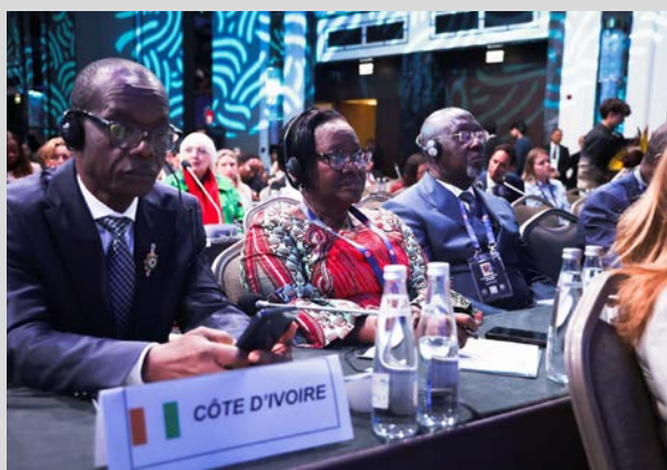
Des membres de la délégation ivoirienne