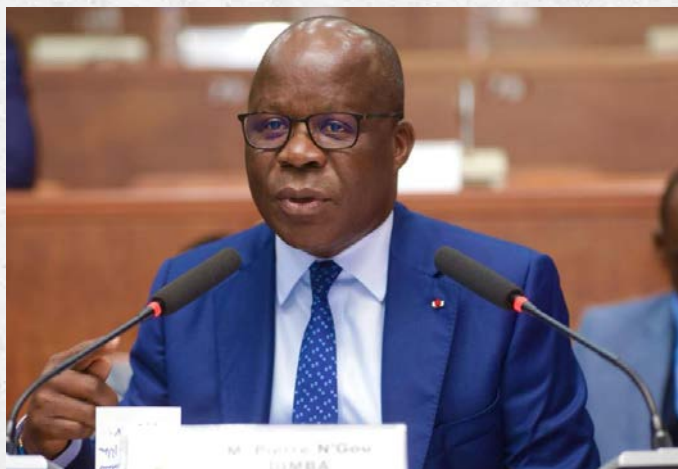
Monsieur Pierre N'Gou DIMBA, Ministre de la Santé, de l'Hygiène publique et de la Couverture Maladie Universelle, lors de l'examen par la Commission des Affaires Sociales et Culturelles (CASC) d'un (01) projet de loi - 9 juin 2026