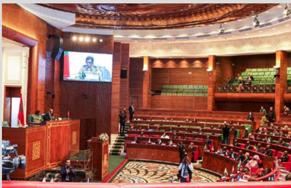
Une vue de la salle de la réunion

Il convient de souligner qu'entre octobre 2024 et avril 2026, le nombre de pays membres de l'Association a doublé, passant d'une dizaine à une vingtaine, avec des adhésions provenant de toutes les régions d'Afrique et regroupant des pays arabophones, anglophones, francophones et lusophones. Fruit de l'engagement personnel de Madame la Présidente du Sénat ivoirien et première Présidente de l'Association des Sénats d'Afrique, cette évolution illustre les capacités diplomatiques de la Côte d'Ivoire portées par Son Excellence Monsieur Alassane OUATTARA.