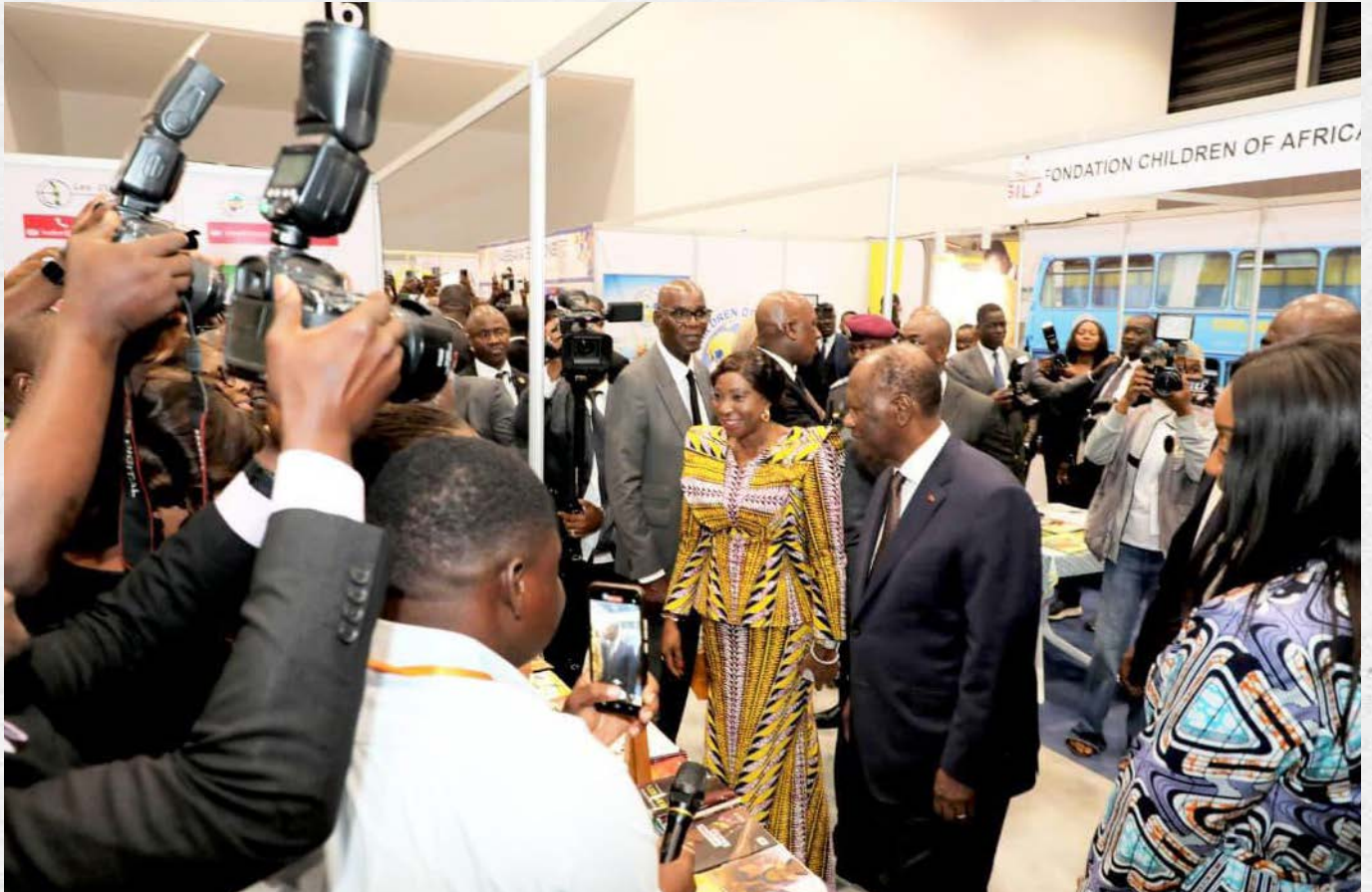
La Présidente du Sénat aux côtés du Chef de l'Etat lors de la visite des stands

La Présidente du Sénat, Madame Kandia CAMARA, a pris part, le mercredi 29 avril 2026, à la cérémonie d'ouverture de la 16 ème édition du Salon international du livre d'Abidjan (SILA), tenue au Parc des expositions d'Abidjan, en présence du Président de la République, Son Excellence Monsieur Alassane OUATTARA.