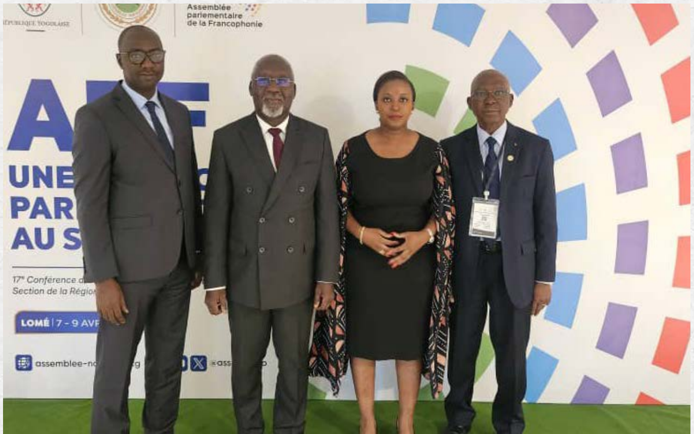
Les membres de la délégation ivoirienne présents à la conférence

Le Sénat de Côte d'Ivoire a pris part à la 17 e Conférence des Présidents d'Assemblées et de Sections de la Région Afrique de l'Assemblée parlementaire de la Francophonie (APF), tenue du 7 au 9 avril 2026 à Lomé, en République togolaise.