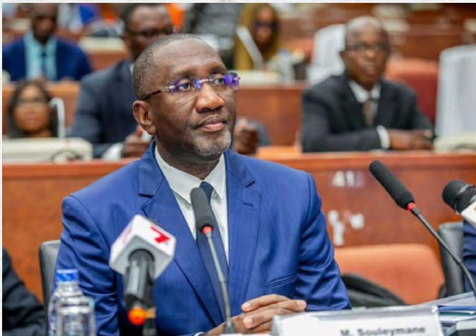
Monsieur Souleymane DIARRASSOUBA, Ministre du Plan et du Développement, lors de l'examen par la Commission des Affaires Economiques et Financières du projet de loi portant Plan National de Développement (PND) 2026-2030 - 27 avril 2026