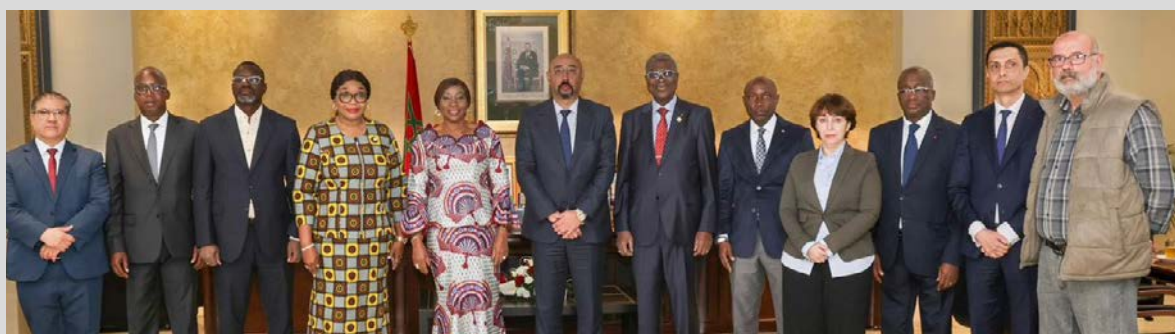
Photo d'ensemble des délégations ivoirienne et marocaine

Par ailleurs, Madame la Présidente du Sénat a également mis en lumière l'excellence des relations entre la Côte d'Ivoire et le Royaume du Maroc, sous l'impulsion des Chefs d'État des deux pays.