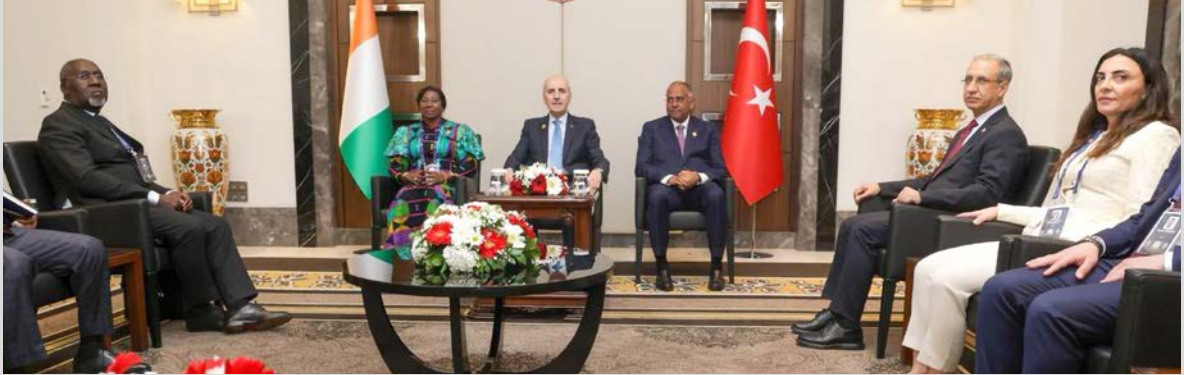
Une vue de la salle de l'audience

En marge de la 152 e Assemblée de l'Union Interparlementaire (UIP), les Présidents des deux Chambres du Parlement ivoirien, Madame Kandia CAMARA et Monsieur Patrick ACHI, ont échangé avec Monsieur Numan KURTULMUŞ, Président de la Grande Assemblée nationale de Türkiye, le jeudi 16 avril 2026, à Istanbul.