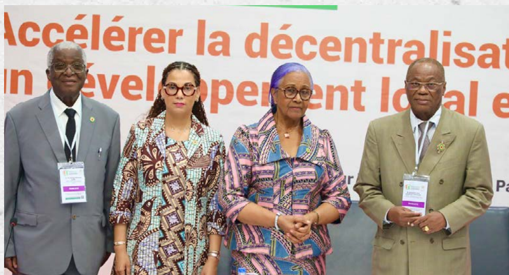
Les intervenants du panel 5

Les échanges ont permis de souligner les actions déjà engagées par le Sénat en faveur des Collectivités territoriales, tout en mettant en exergue plusieurs pistes d'amélioration visant à renforcer son rôle d'interface entre l'État et les Collectivités locales.