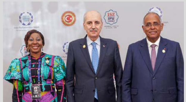
(De gauche à Droite) Madame Kandia CAMARA, Présidente du Sénat de Côte d'Ivoire, Monsieur Numan KURTULMUŞ, Président de la Grande Assemblée nationale de Türkiye, Monsieur Patrick ACHI, Président de l'Assemblée nationale de Côte d'Ivoire

À son tour, Monsieur Patrick ACHI a souligné le renforcement des relations économiques entre la Côte d'Ivoire et la Türkiye, marqué par la présence croissante d'entreprises turques dans les secteurs de la construction et des infrastructures. Il a encouragé un rôle accru des groupes d'amitié parlementaires dans la consolidation de cette coopération entre les deux pays.