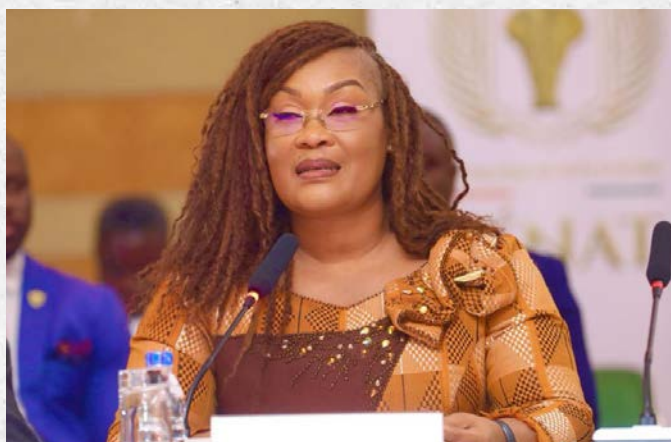
Madame Logboh Myss Belmonde DOGO, Ministre de la Cohésion nationale, de la Solidarité et de la Lutte contre la Pauvreté, lors de l'examen par la Commission des Affaires Sociales et Culturelles (CASC) d'un (01) projet de loi - 9 juin 2026