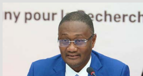
Monsieur Moussa SANOGO, Ministre de l'Urbanisme, du Logement et du Cadre de vie, Maire de la commune de Touba

« On perd de vue bien souvent la question de l'autonomie. L'autonomie, ce n'est pas un État qui vous donne de l'argent et vous êtes autonome par rapport à ça. Le prérequis, c'est de savoir mobiliser les ressources et, en vertu des ressources que vous mobilisez, savoir vous affranchir de certains principes administratifs qui vous donnent la possibilité d'aller plus loin dans l'exécution de vos projets ».