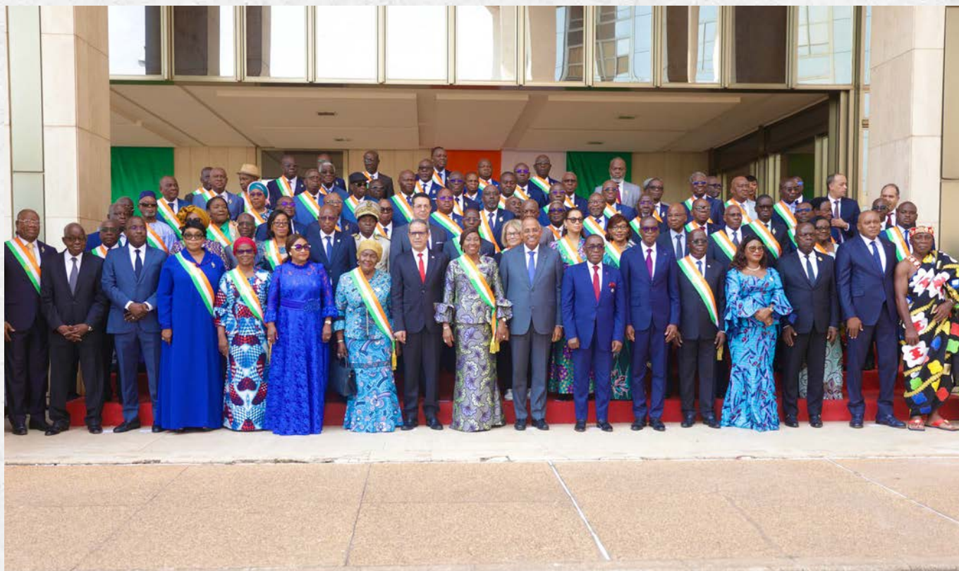
Photo d'ensemble à l'issue de la cérémonie d'ouverture de la première session ordinaire 2026 du Sénat

Enfin, saluant les performances économiques et la stabilité de la Côte d'Ivoire, la Présidente du Sénat, Madame Kandia CAMARA a exhorté les Sénateurs à faire preuve de rigueur, d'intégrité et de solidarité dans l'exercice de leur mandat, afin de contribuer à la consolidation d'une Nation unie, pacifique et résolument tournée vers le progrès.