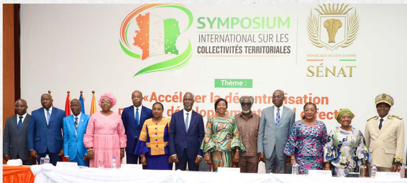
Photo d'ensemble des officiels présents à la clôture du Symposium

En définitive, la Présidente du Sénat, Madame Kandia CAMARA, a réaffirmé l'engagement du Sénat à assurer le suivi des recommandations issues du Symposium afin de contribuer à une gouvernance territoriale plus performante, au service du développement harmonieux des territoires et du bien-être des populations.