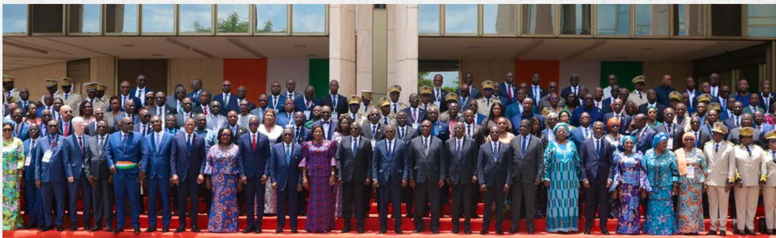
Photo d'ensemble à l'issue de la cérémonie d'ouverture

Les travaux ont permis de mettre en lumière les avancées enregistrées dans le processus de décentralisation, mais également les défis persistants liés au financement des Collectivités territoriales, à l'autonomie locale, au renforcement des capacités administratives et à la clarification des compétences transférées.