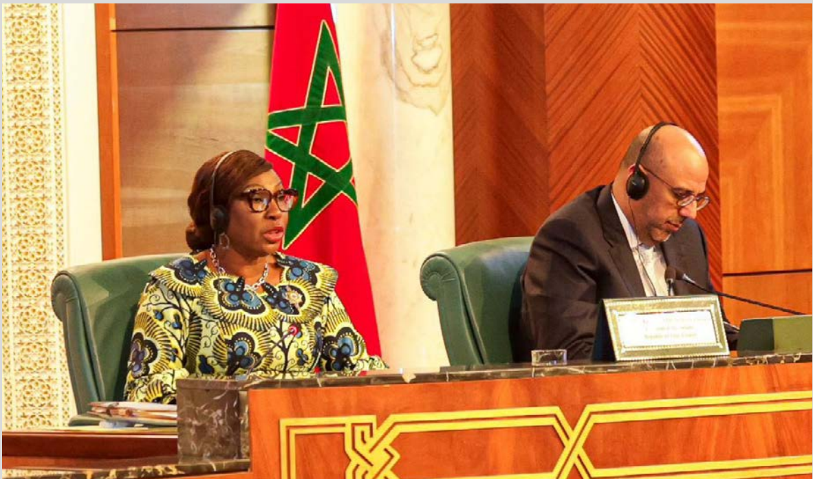
Madame Kandia CAMARA, Présidente du Sénat ivoirien, et Monsieur Mohamed Ould ERRACHID, Président de la Chambre des Conseillers du Royaume du Maroc, ont co-présidé la réunion de l'Association des Sénats d'Afrique

Association des Sénats d'Afrique : Après un bilan largement positif, la Présidente Kandia CAMARA passe la main au Président Mohamed Ould ERRACHID du Maroc