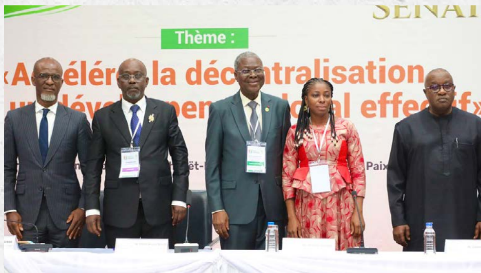
Les intervenants du panel 2

Les échanges autour du thème : « Le financement des Collectivités territoriales : vers un modèle plus efficace et équitable » ont permis d'analyser les mécanismes actuels de financement, d'en identifier les limites et d'explorer des pistes de réformes en vue de renforcer l'autonomie financière des Collectivités et de promouvoir une meilleure équité entre les territoires.