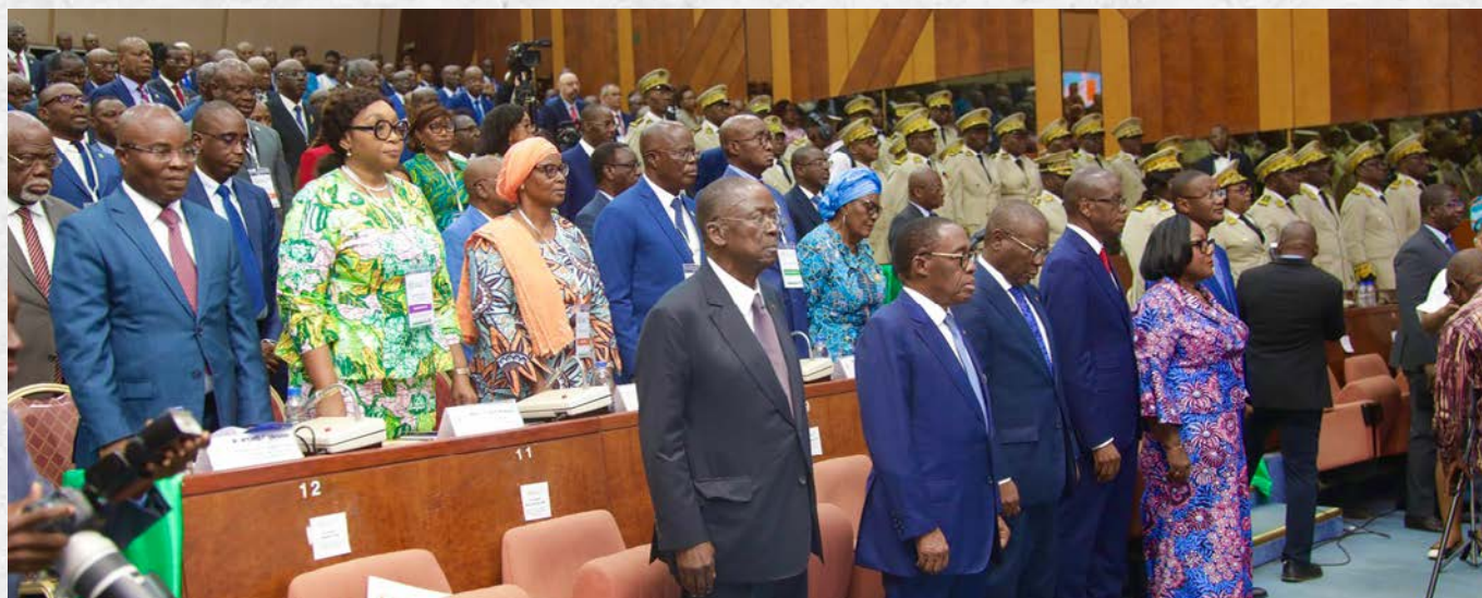
Une vue de la salle

pour moderniser les Collectivités territoriales et renforcer la gouvernance locale.