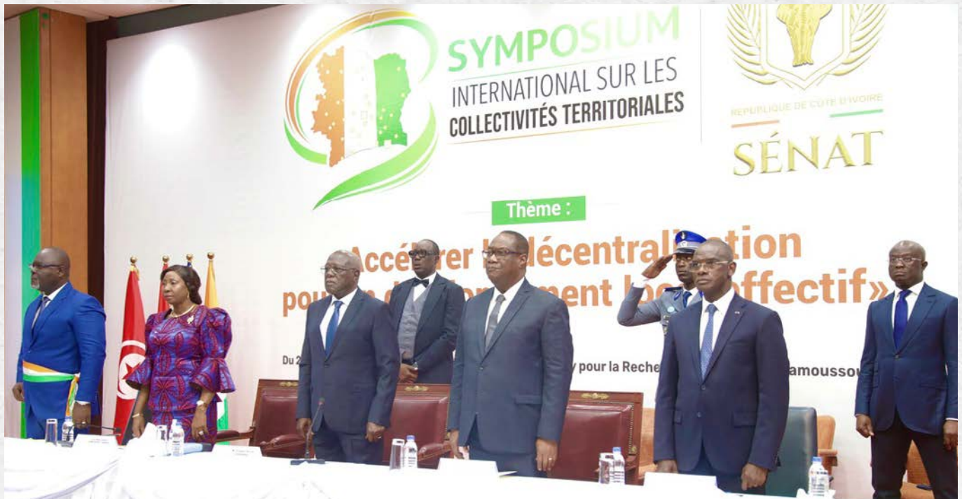
Les officiels sur la table de séance debout pour l'hymne national

Le Sénat de Côte d'Ivoire a organisé, du 26 au 28 mars 2026 à Yamoussoukro, un Symposium international sur les Collectivités territoriales autour du thème : « Accélérer la décentralisation pour un développement local effectif ». Cette rencontre de haut niveau a réuni autorités gouvernementales, élus locaux, experts nationaux et internationaux ainsi que plusieurs partenaires institutionnels afin de réfléchir aux défis et perspectives de la gouvernance territoriale en Côte d'Ivoire.