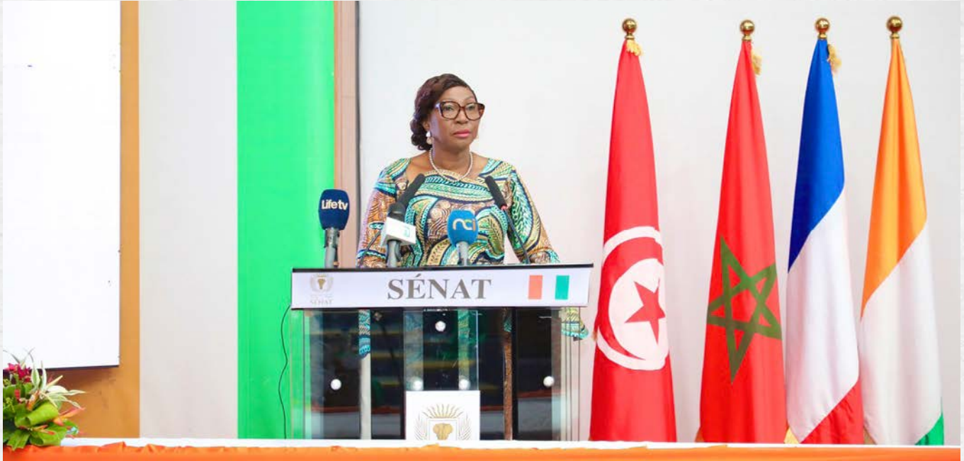
Discours de clôture de Madame la Présidente du Sénat

Au terme de trois jours de réflexions et d'échanges à Yamoussoukro, les participants au Symposium international sur les Collectivités territoriales, organisé du 26 au 28 mars 2026 par le Sénat de Côte d'Ivoire, ont formulé plusieurs recommandations destinées à renforcer l'efficacité de la politique de décentralisation et à améliorer la gouvernance territoriale.