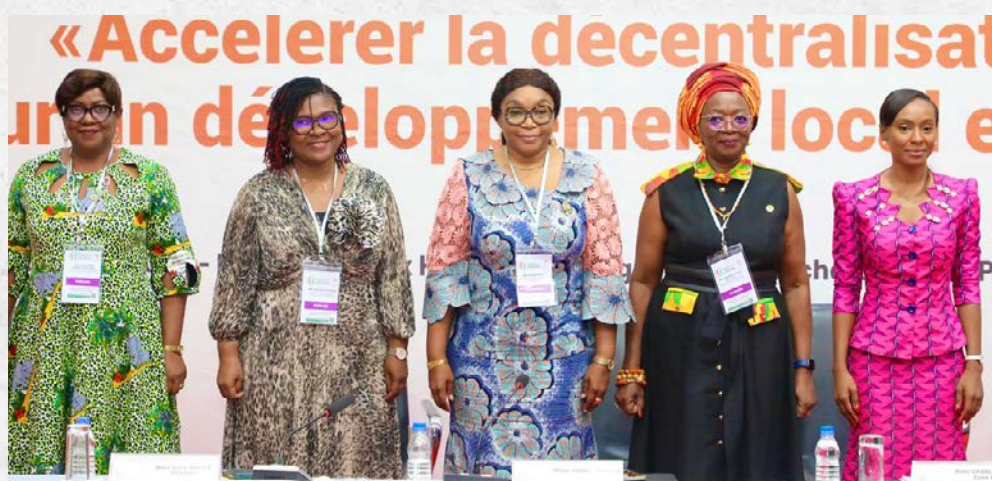
Les intervenantes du panel 6

Les échanges ont souligné qu'une gouvernance inclusive, juste et représentative constitue un levier essentiel pour un développement durable des territoires. Les participants ont également examiné la contribution des femmes aux processus décisionnels locaux, en relevant à la fois les avancées enregistrées et les défis persistants.