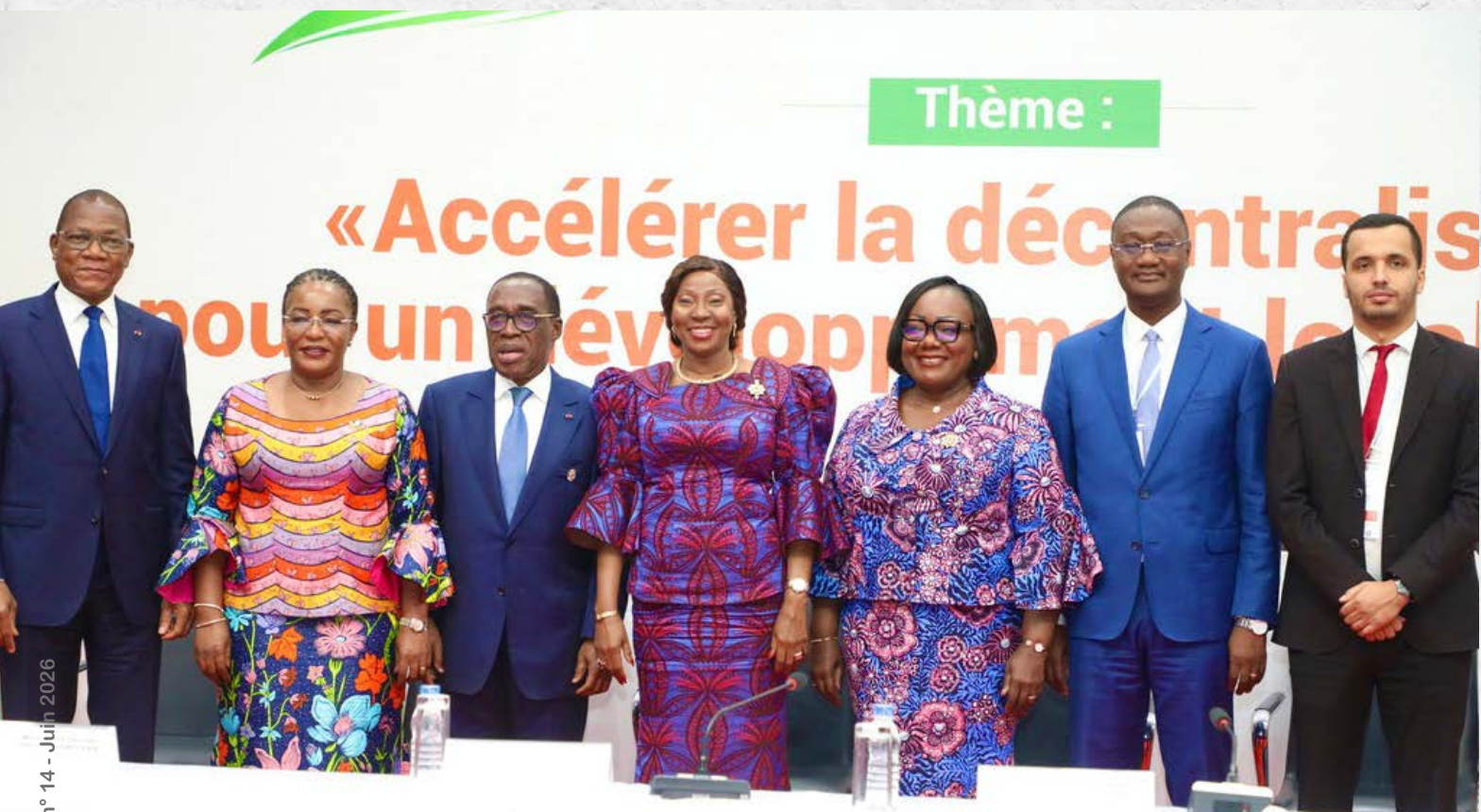
Les intervenants du panel inaugural

particulièrement en matière de transfert de compétences, de mobilisation des ressources et de gouvernance territoriale. Les discussions ont également souligné la place centrale des communes, en tant que Collectivités de proximité répondant aux préoccupations des populations. Le panel s'est enrichi d'une approche comparative à travers le partage de l'expérience tunisienne en matière de gouvernance des Collectivités territoriales.