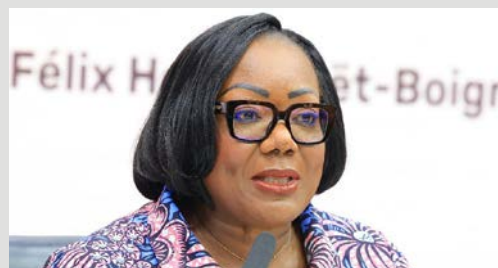
Madame Anne Désirée OULOTO LAMIZANA, Ministre d'État, Ministre de la Fonction Publique et de la Modernisation de l'Administration, Présidente du Conseil Régional du Cavally

Nous avons besoin d'un véritable coup d'accélérateur. La décentralisation n'est pas une simple réforme administrative ; c'est une réforme de gouvernance, une réforme de développement et de proximité entre l'État et les citoyens ».