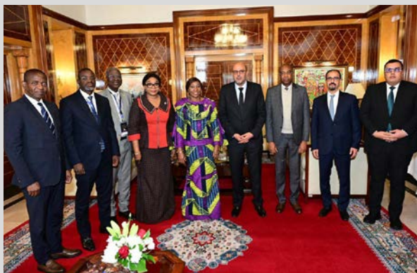
Photo d'ensemble des délégations ivoirienne et marocaine