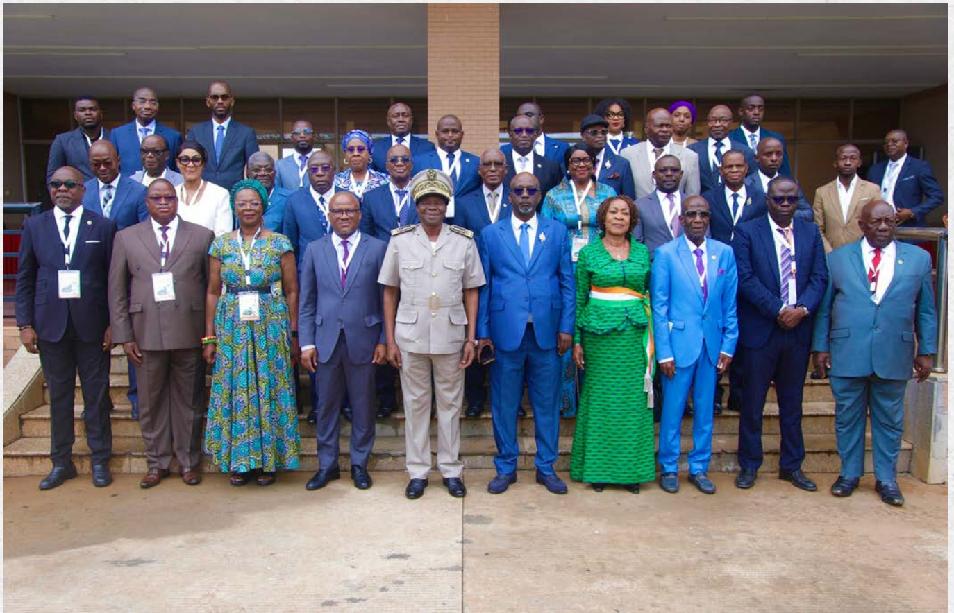
Photo d'ensemble des participants

Un atelier institutionnel consacré aux textes sur les énergies renouvelables et l'efficacité énergétique s'est tenu les 18 et 19 mai 2026, à Yamoussoukro, à l'intention des Sénateurs membres de la Commission des Affaires Économiques et Financières (CAEF).