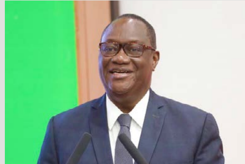
Monsieur Téné Birahima OUATTARA, Vice-Premier Ministre, Ministre de la Défense, Président du Conseil régional du Tchologo

« La création du Sénat, qui consacre l'instauration du bicamérisme dans notre pays depuis 2016, procède de la volonté du Président Alassane OUATTARA de renforcer la représentativité des territoires dans la vie institutionnelle et dans le processus de décision nationale. (...) Une démocratie moderne et équilibrée doit être à même de prendre en compte les réalités et aspirations de l'ensemble de ses territoires ».