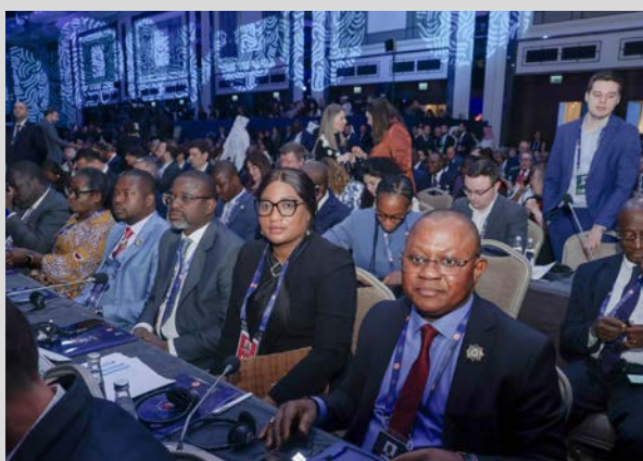
Des membres de la délégation ivoirienne