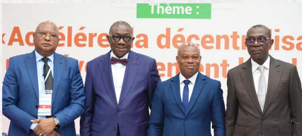
Les intervenants du panel 3

Les participants ont souligné l'urgence d'engager des réformes adaptées aux exigences de la décentralisation et aux attentes des populations. En définitive, le panel a permis de dégager plusieurs pistes de réflexion en faveur d'un statut plus clair, plus équitable et valorisant pour les acteurs des Collectivités territoriales.