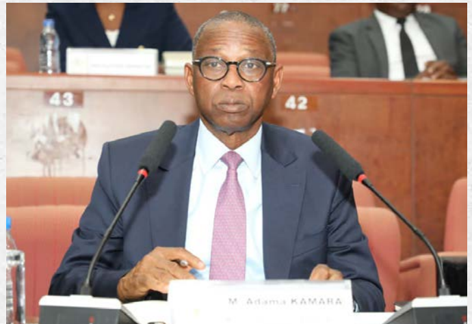
Monsieur Adama KAMARA, Ministre de l'Emploi, de la Protection Sociale et de la Formation Professionnelle, lors de l'examen par la Commission des Affaires Sociales et Culturelles (CASC) de deux (02) projets de loi - 27 avril 2026