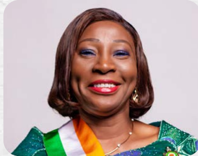
Madame Kandia CAMARA (Présidente du Sénat) Présidente d'honneur