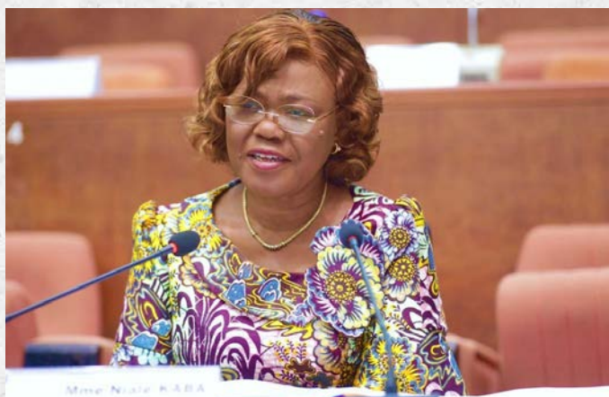
Madame Kaba NIALÉ, Ministre d'État, Ministre des Affaires Etrangères et de la Coopération Internationale, lors de l'examen par la Commission des Relations Extérieures et des Ivoiriens Établis Hors de Côte d'Ivoire (CREIHCI) de cinq (05) projets de loi - 9 juin 2026