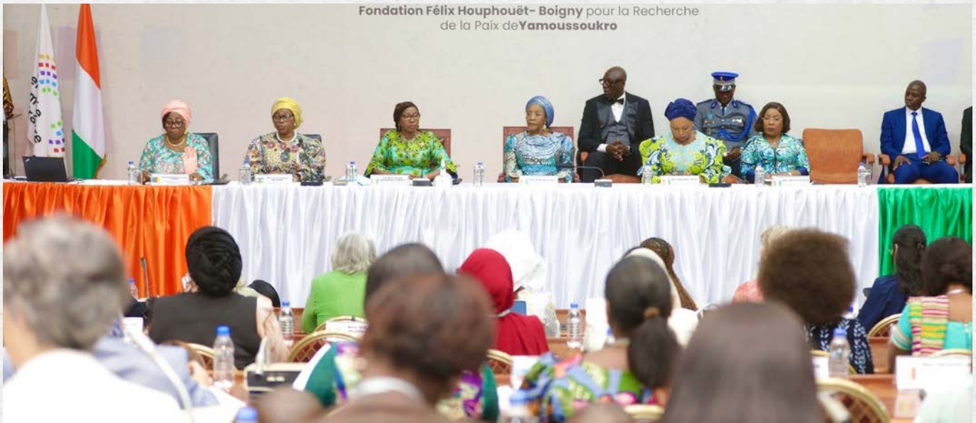
Une vue de la salle lors de l'ouverture de la réunion intersessionnelle du Réseau des Femmes parlementaires de l'Assemblée Parlementaire de la Francophonie (APF)