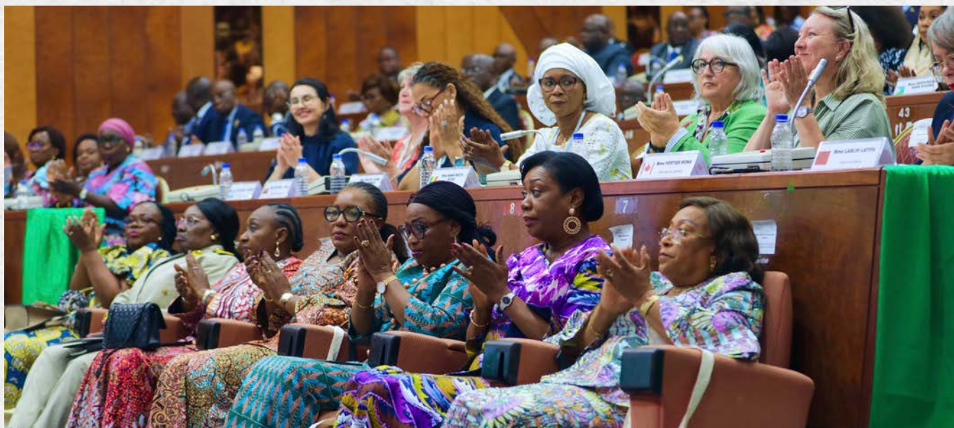
Une vue de la salle

Dans son allocution, Madame Kandia CAMARA a salué le choix porté sur la Côte d'Ivoire pour accueillir cette rencontre consacrée à la promotion des droits des femmes et au renforcement du leadership féminin dans l'espace francophone. Elle a insisté sur la nécessité de renforcer l'action parlementaire face aux défis liés aux inégalités de genre, au sexisme et à la traite des personnes, tout en appelant les femmes parlementaires à poursuivre leur engagement en faveur de sociétés plus justes et inclusives. La Présidente du Sénat a également rendu hommage à Son Excellence Monsieur Alassane OUATTARA et à Madame Dominique OUATTARA pour leur engagement constant en faveur de la promotion et de l'autonomisation des femmes.