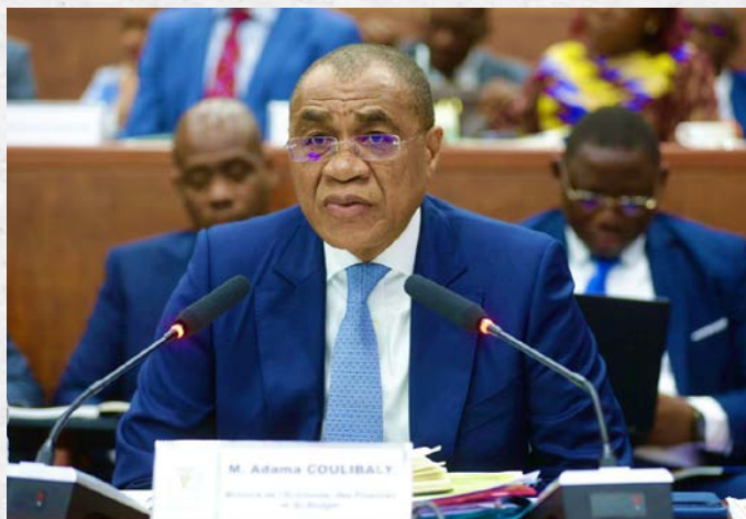
Monsieur Adama COULIBALY, Ministre de l'Économie, des Finances et du Budget, lors de l'examen par la Commission des Affaires Économiques et Financières (CAEF) de trois projets (03) de loi - 8 juin 2026