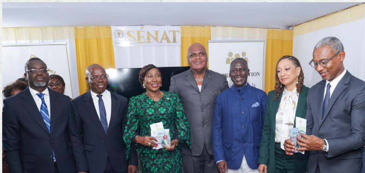
Photo d'ensemble des officiels au stand du Sénat de Côte d'Ivoire

Au-delà de son caractère culturel, le festival contribue au développement économique local en favorisant la création d'opportunités et en participant à l'amélioration des conditions de vie de nombreuses familles.