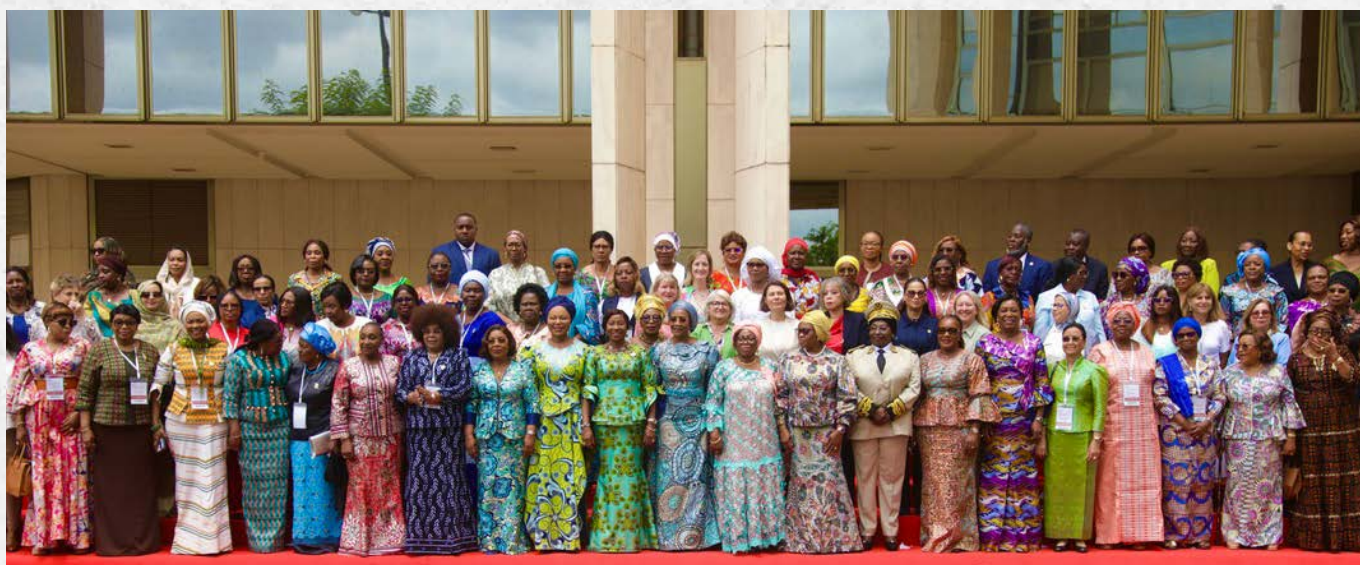
Photo d'ensemble à l'issue de la cérémonie d'ouverture

Créé en 2002 par l'Assemblée parlementaire de la Francophonie (APF), le Réseau des Femmes parlementaires a pour mission de renforcer la participation des femmes à la vie publique dans l'espace francophone. Il œuvre à valoriser leur rôle au sein des parlements et des instances internationales, à encourager les échanges d'expériences et la solidarité, tout en contribuant activement à la promotion des droits des femmes et des enfants.