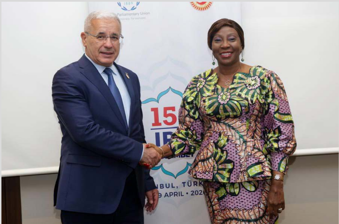
Madame Kandia CAMARA, Présidente du Sénat de Côte d'Ivoire, et Monsieur Brahim BOUGALI, Président de l'Assemblée populaire nationale d'Algérie

En marge des travaux de la 152 e Assemblée de l'Union interparlementaire (UIP) à Istanbul, Madame Kandia CAMARA, Présidente du Sénat de Côte d'Ivoire, s'est entretenue avec Monsieur Brahim BOUGALI, Président de l'Assemblée populaire nationale d'Algérie, le 15 avril 2026.