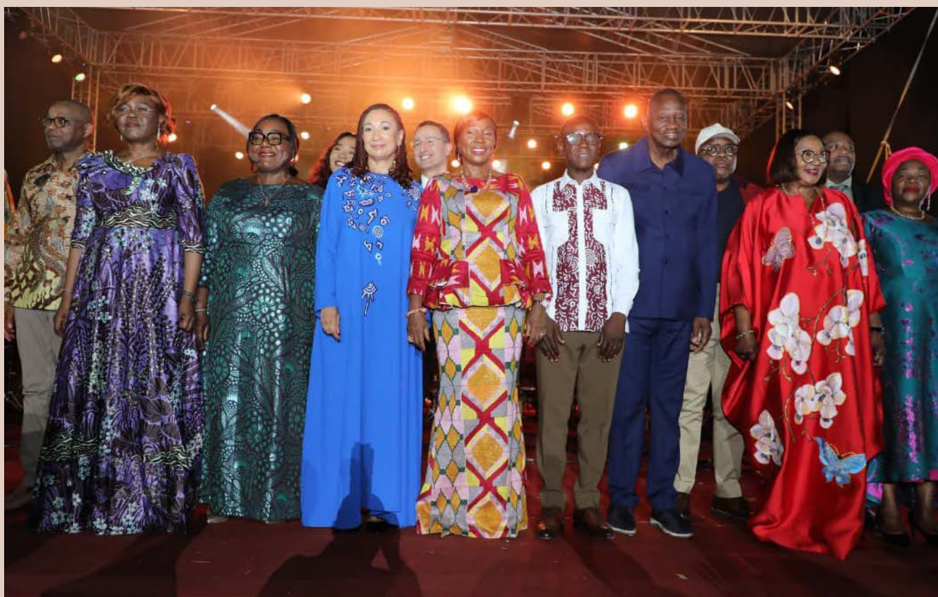
Photo d'ensemble des officiels présents à la clôture du MASA 2026

La 14 e édition du Marché des Arts du Spectacle d'Abidjan (MASA) s'est tenue du 11 au 18 avril 2026 au Palais de la Culture de Treichville, autour du thème : « Arts du spectacle en Afrique, outil d'intégration économique et sociale ».