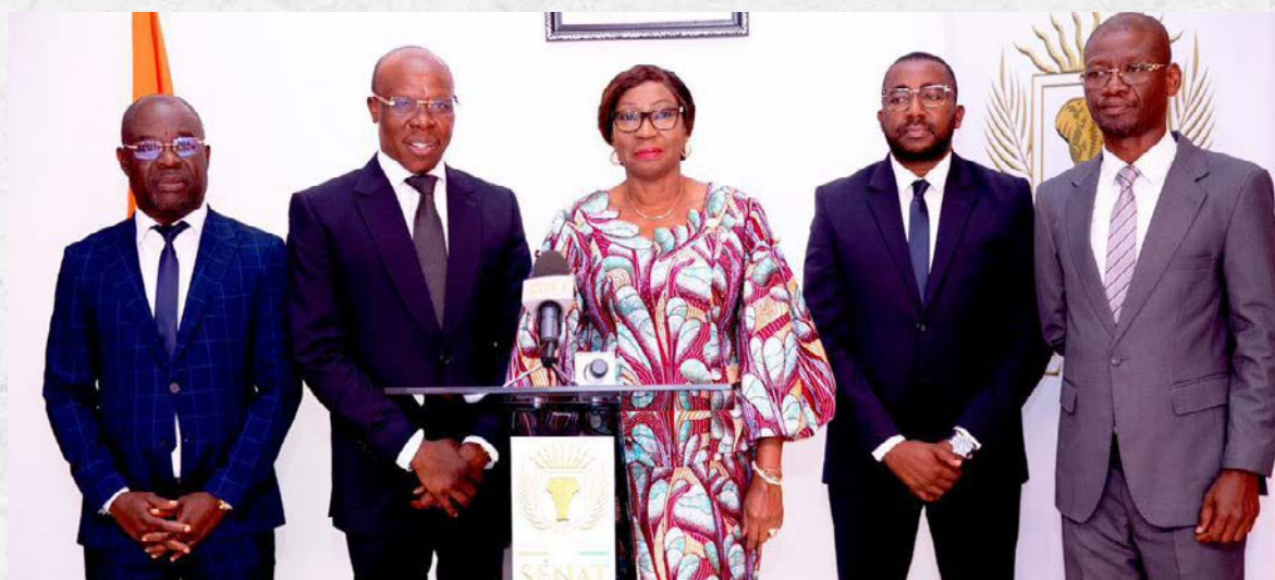
La Présidente du Sénat (au centre) en compagnie des membres du groupe Magic System

Elle a également souligné la dimension panafricaine du FEMUA, devenu au fil des années une plateforme majeure de rencontres et d'échanges entre les peuples africains. Selon elle, cette vocation rejoint la vision du Président de la République, Son Excellence Monsieur Alassane OUATTARA, en faveur d'une Afrique plus intégrée, solidaire et résolument tournée vers son développement.