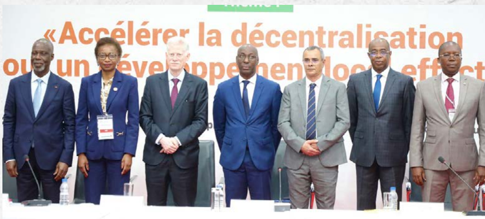
Les intervenants du panel 4

Les discussions se sont articulées autour de trois axes majeurs : la mutualisation des ressources et des compétences, le développement de partenariats interterritoriaux et le renforcement de la compétitivité des territoires.