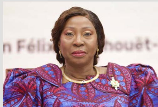
Madame Kandia CAMARA, Présidente du Sénat de Côte d'Ivoire, Maire de la Commune d'Abobo

« Le succès de la politique de décentralisation repose sur une responsabilité partagée. Elle implique l'engagement de l'État, la mobilisation des Collectivités territoriales, les compétences des ressources humaines des Collectivités territoriales, la participation du secteur privé, l'appui des partenaires au développement et l'implication active des citoyens, car en définitive, la force d'une nation se mesure aussi à la capacité de ses territoires à créer de la richesse, à apporter l'innovation et à améliorer concrètement la vie des citoyens ».