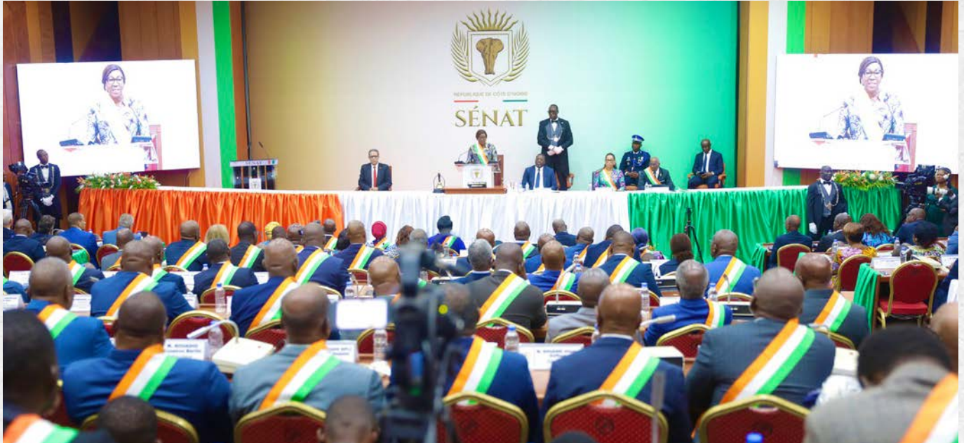
Une vue de l'hémicycle

Le Sénat de Côte d'Ivoire a procédé, le mercredi 28 janvier 2026, à l'ouverture de sa première session ordinaire de l'année, à la Fondation Félix Houphouët-Boigny pour la Recherche de la Paix de Yamoussoukro, conformément aux dispositions de l'article 94 nouveau de la Constitution.