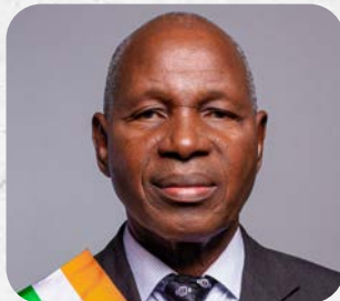
Monsieur DAO Losseni Membre de la Commission des Affaires Parlementaires